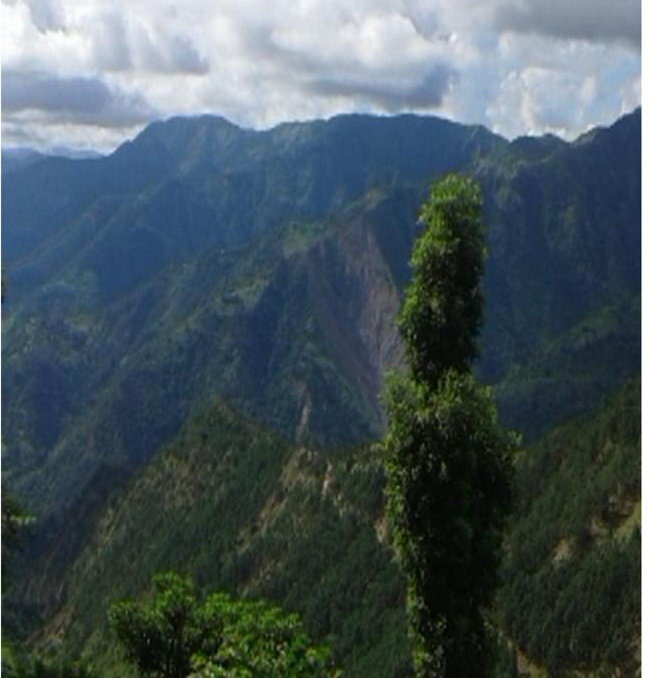
(खानीको लागि प्रस्ताव गरिएको डाँडामा रहेका रुखहरु